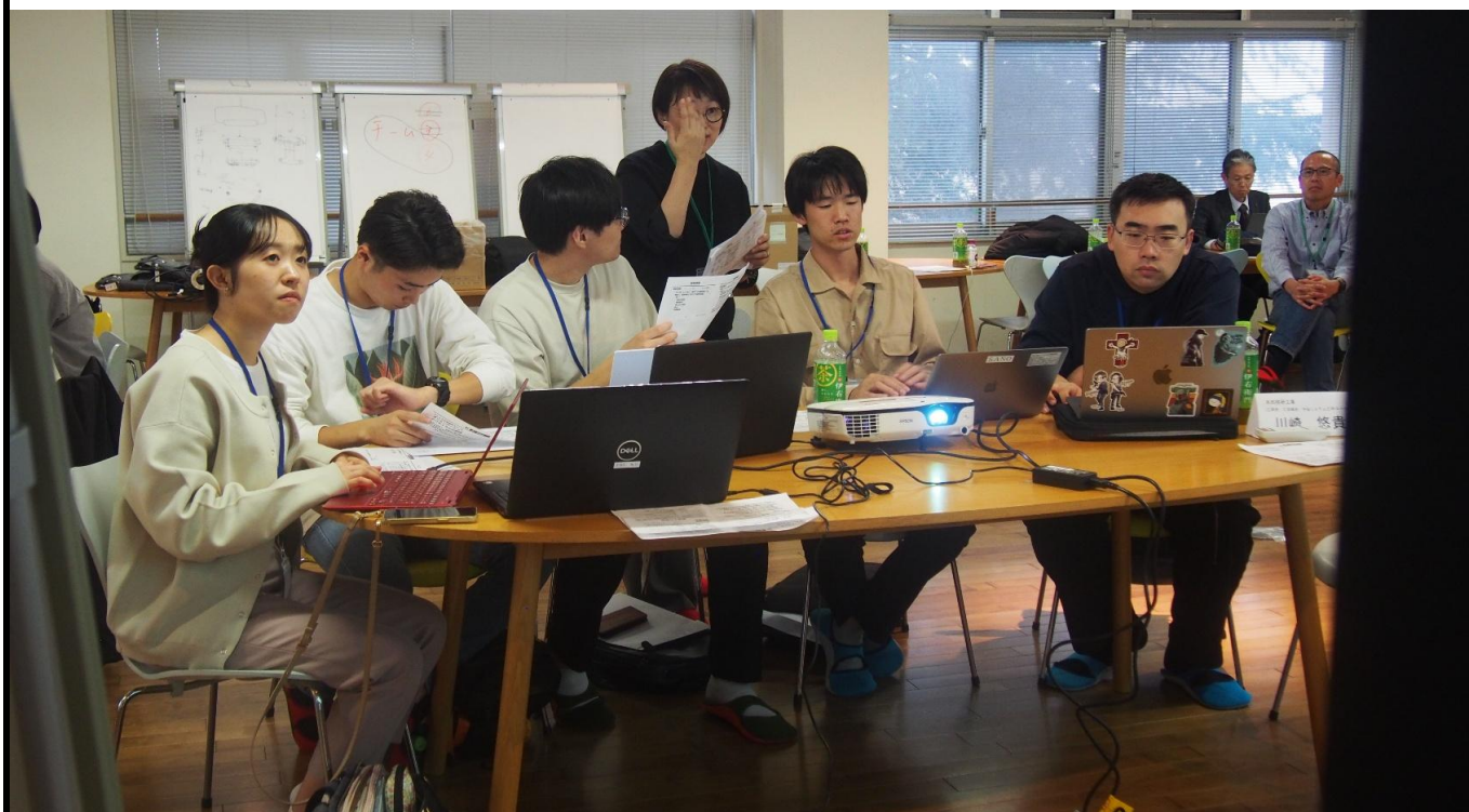
▲ グループ討議の様子